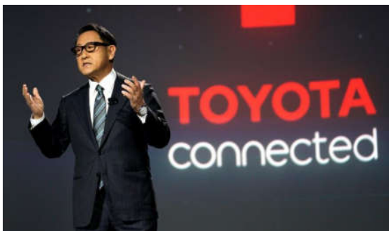
อะกิโอะ โตโยดะ (Akio Toyoda)